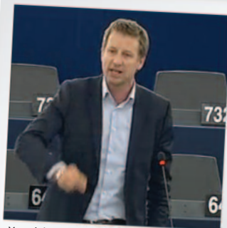
Yannick Jadot, écologiste et européen passionné, dont le rôle est reconnu au sein du Parlement Européen.

Le groupe écologiste et régionaliste compte 58 députés (dont 7 régionalistes). Parmi eux, 16 sont français. Il faut renforcer l'écologie au Parlement européen. La délégation française est essentielle car elle représente plus du quart de l'effectif du groupe des Verts.