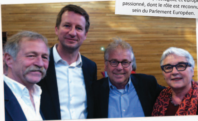
Yannick Jadot et Nicole Kiil-Nielsen avec José Bové, candidat des écologistes pour co-présider avec Ska Keller la commission européenne et Dany Cohn-Bendit, co-président du groupe des écologistes au Parlement européen jusqu'à cette élection du 25 mai