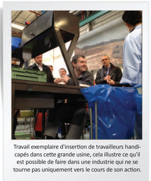
Travail exemplaire d'insertion de travailleurs handicapés dans cette grande usine, cela illustre ce qu'il est possible de faire dans une industrie qui ne se tourne pas uniquement vers le cours de son action.