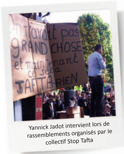
Yannick Jadot intervient lors de rassemblements organisés par le collectif Stop Tafta