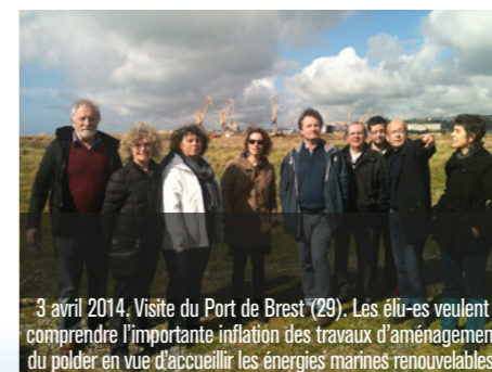
3 avril 2014, Visite du Port de Brest (29). Les élu-es veulent comprendre l'importante inflation des travaux d'aménagement du polder en vue d'accueillir les énergies marines renouvelables.

► Préserver notre environnement, c'est protéger notre cadre de vie. EELV se bat contre l'étalement urbain des zones littorales et rurales, l'artificialisation des sols, lutte pour faire appliquer la loi Littoral, encourage la création de parcs naturels, refuse les mégas-décharges... Un engagement quotidien auprès des collectifs et réseaux citoyens.