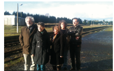
8 décembre 2014 : pour des lignes ferroviaires adaptées aux besoins des usagers - Loudéac (22)