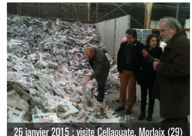
26 janvier 2015 : visite Cellaouate. Morlaix (29)