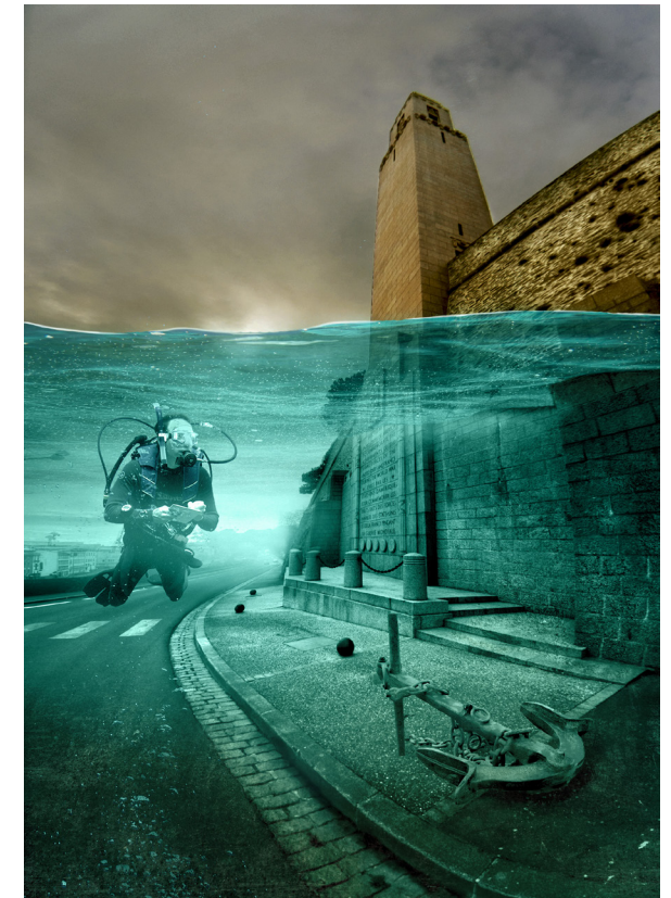
Tonnerre de Brest 2012

Pour s'informer et comprendre les enjeux climatiques, économiques et sociaux, AE2D vous propose les «Mardis du Climat».